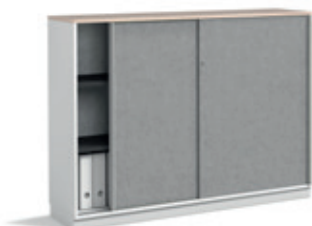
→ Multiplan III. Schranksystem mit NeoTex Fronten