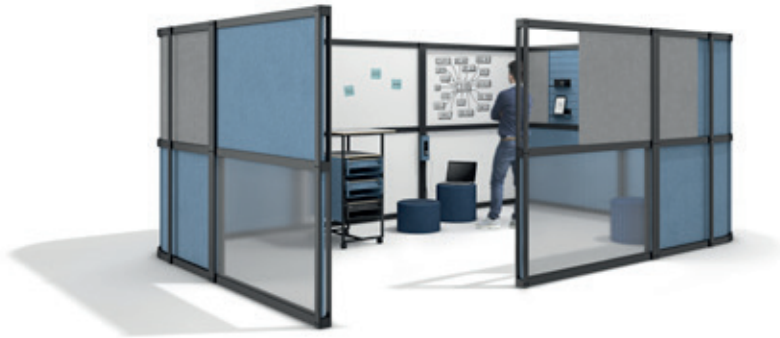
→ Open Wall. Trennwände