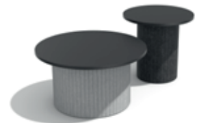
→ Neo Table. Beistelltische