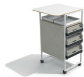
→ Neo Station. mobiler Stauraum mit Neo Trays und Neo Boxen