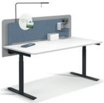
→ Frame. Tischpaneel mit Zubehör