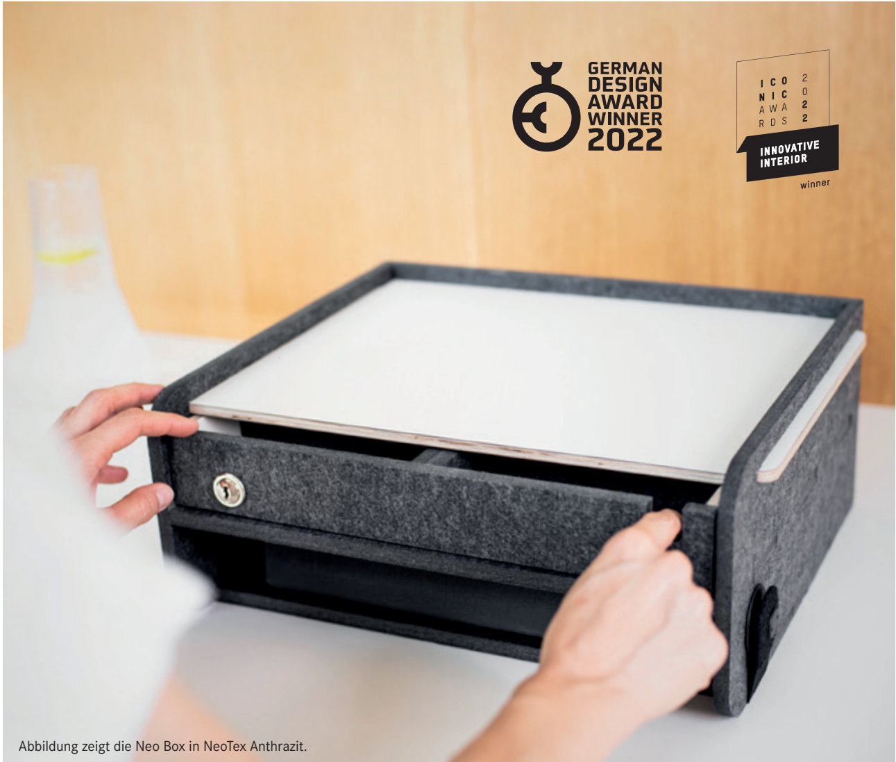
Abbildung zeigt die Neo Box in NeoTex Anthrazit.