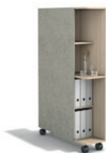
→ Flow Wall. Raumteiler mit Stauraum