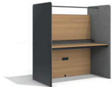
→ Cottage. Module