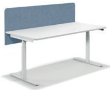
→ NeoTex Tischpaneel